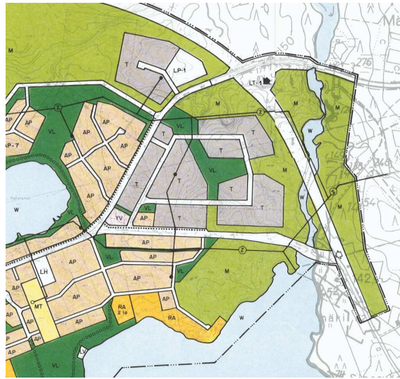
Kuva 3: Kirkonkylän osayleiskaava 1985